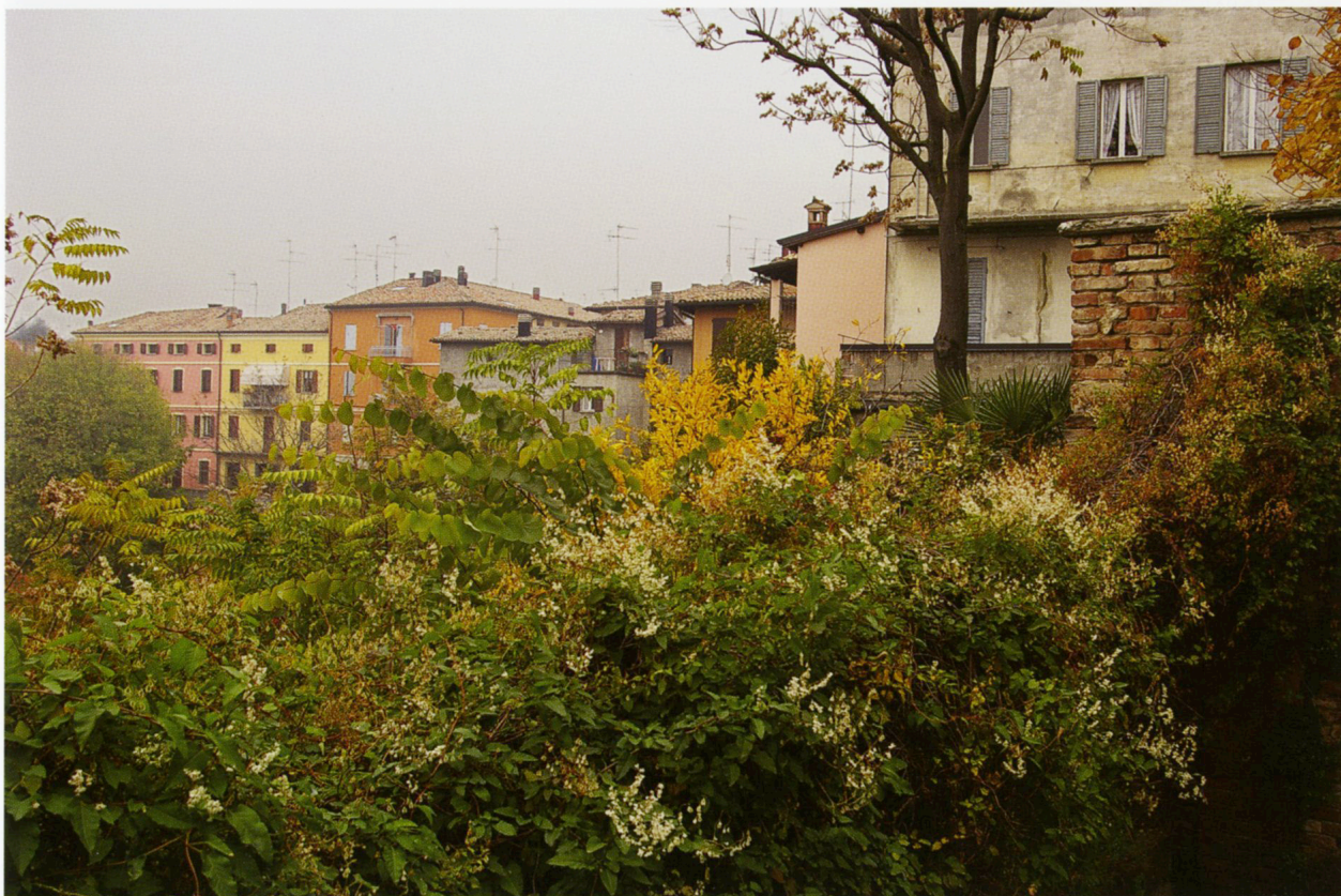
Colori di fiori, colori di muri