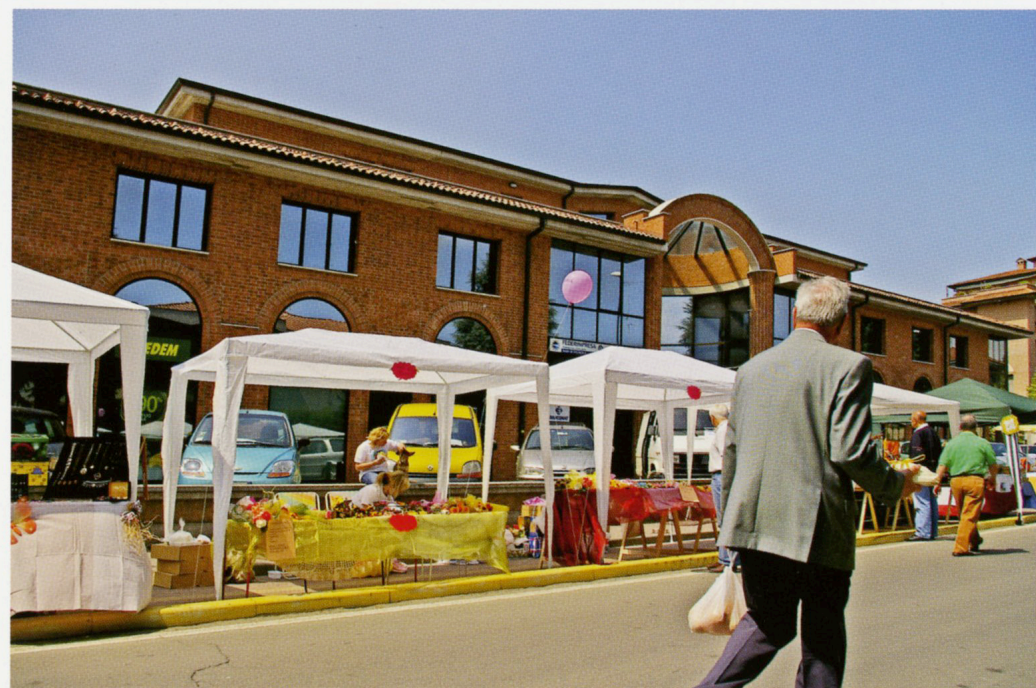
Da Villa Martuzzi, la vallata Simboli vignolesi Il fischio del merlo In Via Resistenza, difficile resistere