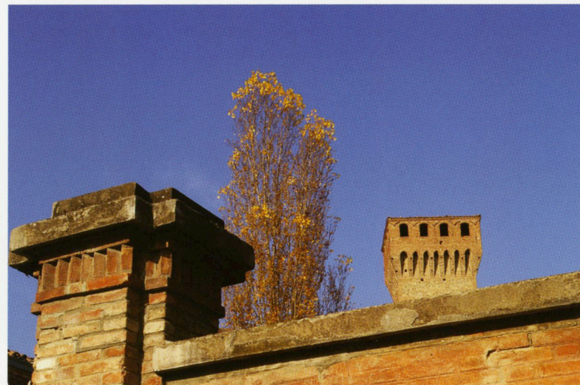
Luci di sole su Villa Leoni