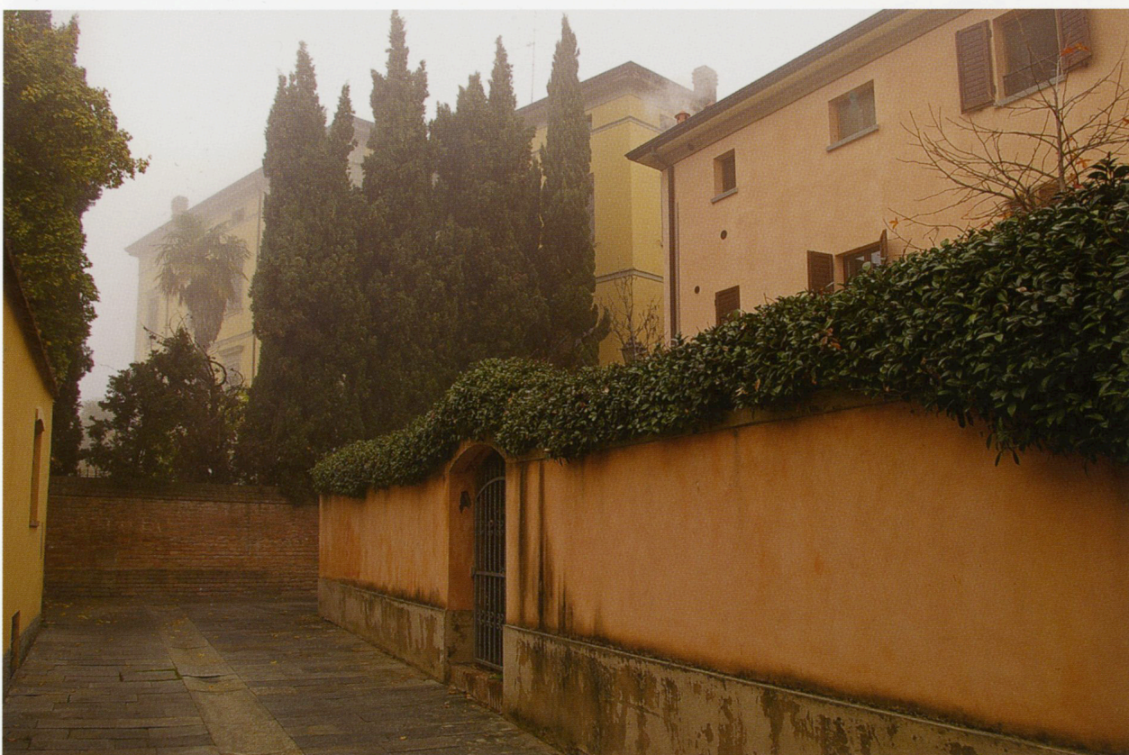
Prospettiva ristretta in Via Belvedere