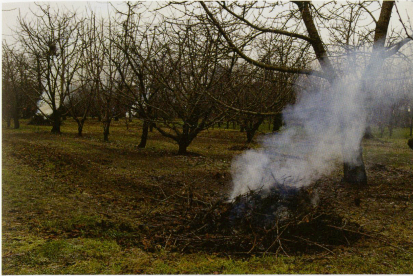
Crocevia rurale Alberi nel cantiere

Dopo la potatura Dalla rotonda verso il centro Tra le bancarelle del mercato I colori delle Corti In sosta ai piedi della Rocca