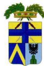
Provincia di Modena