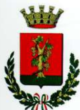
Città di Vignola Comune di Vignola